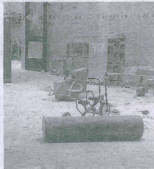
DISTRUTTO L'asilo «Il Panda» di Cascina dopo il passaggio dei vandali che hanno messo tutto a soqquadro

AL MOMENTO è ancora tutta da chiarire l'esatta dinamica dell'incidente. Chi ha assistito alla scena racconta di un episodio 'surreale' avvenuto a una velocità estremamente bassa. «Ho visto il camion che camminava molto lentamente - racconta un passante - e poco a poco ha cominciato ad andare verso sinistra. poi, improvvisamente, si è sbilanciato di lato e si è ribaltato. Sono subito corso sul posto»