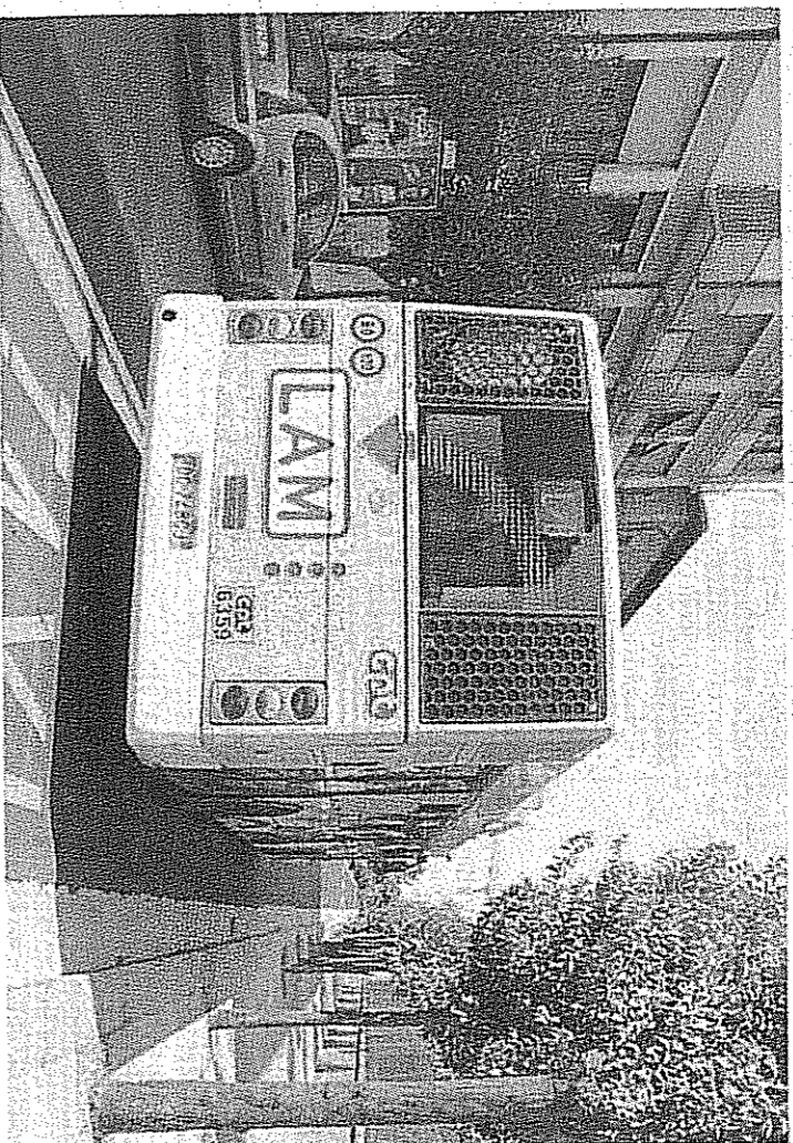
Una delle Lam, quella blu, in servizio sul territorio