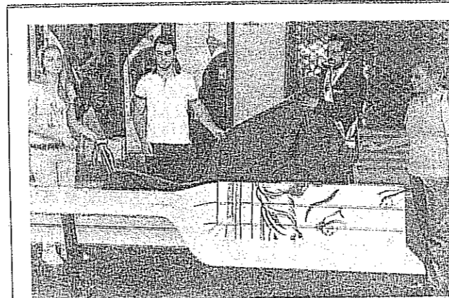
COME QUADRI Una delle tre panchine d'artista inaugurate dal sindaco Antonelli. Evidente l'ispirazione al pittore della pop art Roy Lichtenstein

CASCINA GLI STUDENTI DEL RUSSOLI COLORANO IL CENTRO