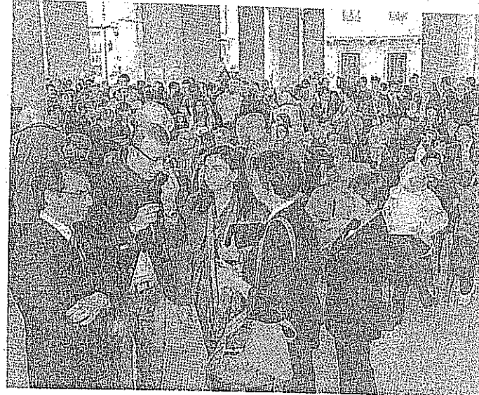
I consigli comunale e provinciale in Logge di Banchi

de della Provincia e nelle scuole superiori dell'intero territorio, dove per domani sono previste mobilitazioni: all'interno di ogni istituto una parte dei ragazzi si riunirà in assemblea; l'altra nelle rispettive aule dove sarà letto un messaggio delle