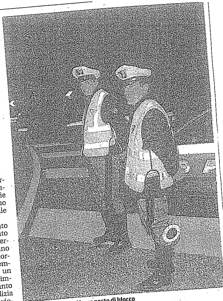
Poliziotti impegnati in un posto di blocco

A quel punto, abbandonato il mezzo a terra, ha continuato la propria fuga a piedi attraverso i campi. Gli agenti hanno continuato ad inseguire il nordafricano, il quale, nel frattempo, tentava di liberarsi di un borsello gettandolo nelle immediate vicinanze. Raggiunto da un operatore della Polizia Stradale, è cominciata una violenta colluttazione in cui il poliziotto riportava delle lesioni. Il marocchino è stato comunque immobilizzato con l'ausilio degli altri operatori intervenuti e sottoposto a controllo. È stato poi rinvenuto il borsello gettato nel campo e al suo interno sono stati trovati due involucri di cellophane contenenti sostanza stupefacente. A quel punto il maroc-