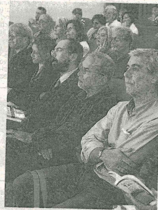
Una parte del pubblico presente alla serata

decadenza del suo storico passato di cui gli edifici sono la memoria e dall'altra dalla sua particolare luce. Una luce lunga che ti accompagna come una melodia che ti segue per la strada. È una luce discreta, non accecante, tenue, bianca».